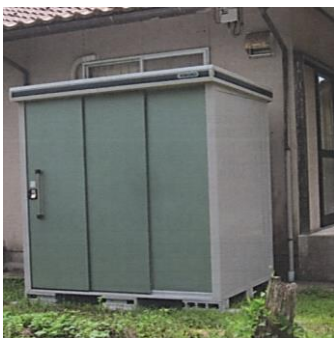
石原老人集会所に設置された倉庫

内で合計9日開設したため、市からの施設運営費(1日500円)×9日の4.5万円を、該当する区へ分配しました。