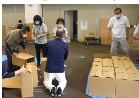
段ボール製ベッド作製