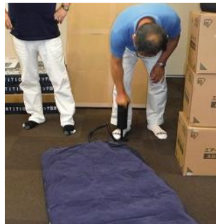
空気マット製ベッド作製