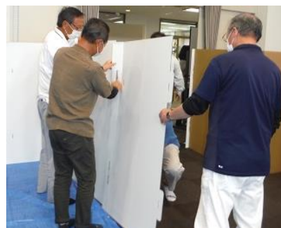
プライベートの空間を確保