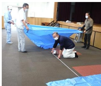
ブルーシートで迅速に設置

ひどい自然災害はいつ起きるか分かりません。協力できることは皆さんで力を合わせ、安全で、快適な避難所の環境作りを目指していきます。