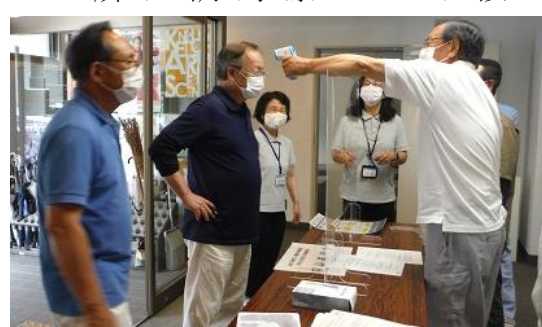
37.5度以上熱がある場合 ホールへの入室不可